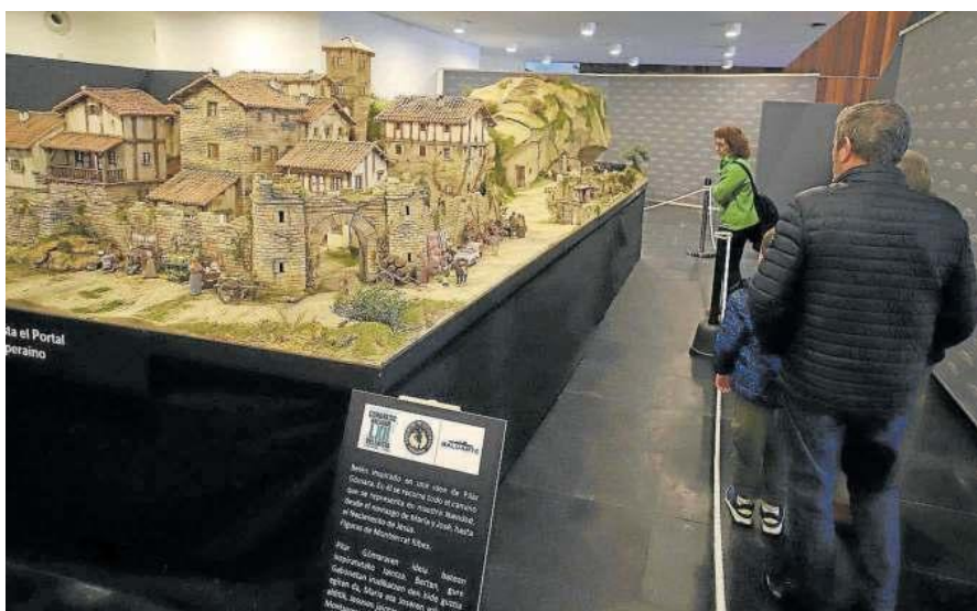
Este belén abierto recorre el camino que se representa en la Navidad, desde el noviazgo de María y José hasta el nacimiento.