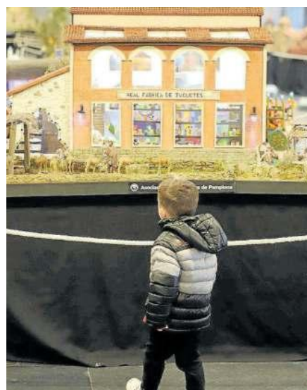
Un pequeño observa el belén de la Real Fábrica de Juguetes.