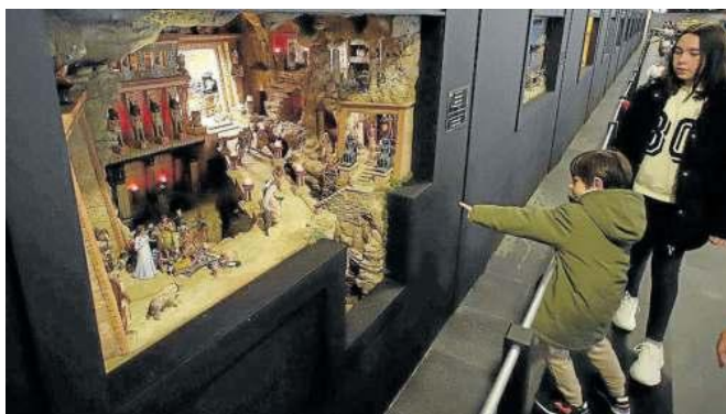
La huida a Egipto, representada en una necrópolis de ese país.