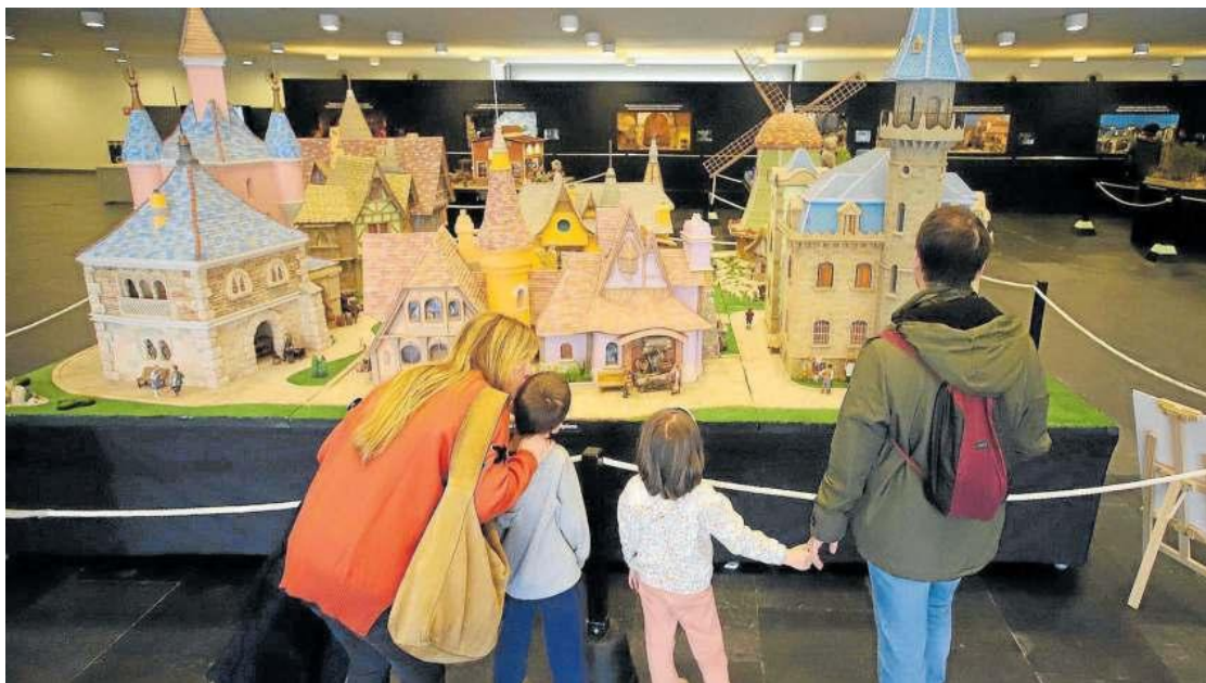
Siete módulos independientes, reagrupados en un enorme conjunto con referencias al mundo Disney y el palacio municipal de Burlada.

● Horario. Hasta el 6 de enero, de 10.30 a 13.30 horas y de 17.00 a 21.00 horas. Los días 24 y 31 de diciembre se cierra a las 19.00 horas. ● Precio. En la taquilla de la exposición, sin venta anticipada. Tres euros para mayores de 14 años, un euro para personas de 7 a 14 años, y gratis los menores de 7 años. ● Actividades complementarias. Visitas escolares a la exposición, del 9 al 13 de diciembre por las mañanas (días laborables, previa inscripción). Visitas guiadas a la exposición, del 9 al 13 de diciembre por las tardes (días laborables, previa inscripción). Demostraciones de técnicas belenistas, días 16, 17, 18, 19, 20, 23, 26, 27, y 30 de diciembre y 2 y 3 de enero, por la tarde. Talleres infantiles de belénismo, 27 y 28 diciembre y 3 de enero. La noche del belén, 28 de diciembre.