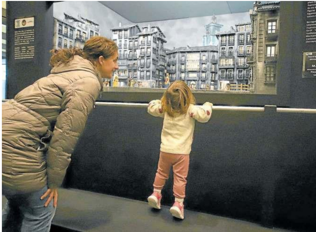
Esta pequeña se asoma a la plaza Consistorial en los años 50, belén que representa una fotografía en blanco y negro.